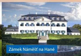
Zámek Náměšť na Hané