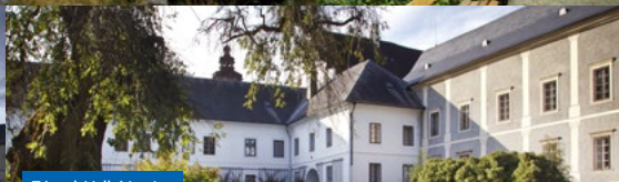
Zámek Velké Losiny