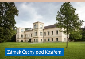
Zámek Čechy pod Kosířem