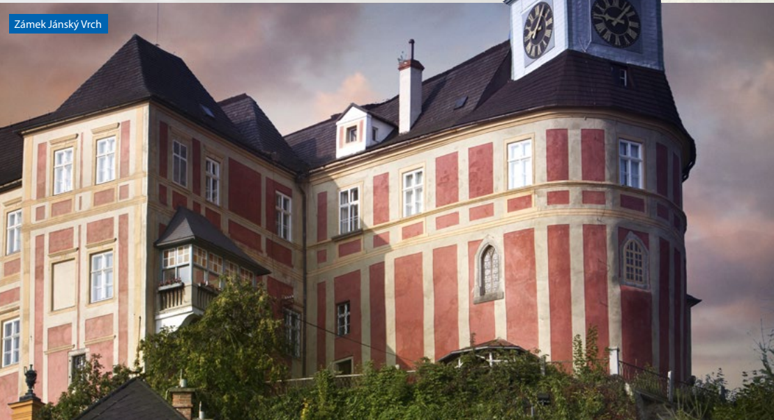
Zámek Jánský Vrch

Květen, červen: úterý, středa, čtvrtek: 9:00 – 11:00, 13:00 – 15:00, pondělí, pátek zavřeno, červenec, srpen: úterý, čtvrtek: 9:00 – 11:00, 13:00 – 15:00, pondělí, středa, pátek zavřeno, září: úterý: 9:00 – 11:00, 13:00 – 15:00, pondělí, středa, čtvrtek, pátek zavřeno