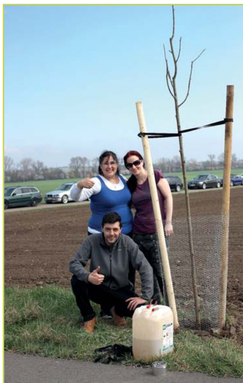
Klub BMW Morava

Jsme fandové automobilové značky BMW. O těchto řidičích se říká spousta špatného. Chtěli bychom to alespoň nepatrně vyvrátit. Dnes jsme v katastru Nezamyslic, ve spolupráci s firmou Sazíme stromy z. ú., starostou a místostarostkou městyse Nezamyslice dohodli a následně zrealizovali výsadbu stromků. Zasadili jsme 20 ovocných stromků kolem cyklostezky. Byla to naše první akce a budeme v ní následně pokračovat i v jiných obcích. Jen doufáme, že stromky vydrží a nestanou se zájmem vandalů. Prosím, nechejte stromky žít, ony se neumí bránit. Budeme rádi, když ve spolupráci s obcí zasadíme na podzim další nemalou várku. Děkujeme všem za účast. Přírodě zdar!