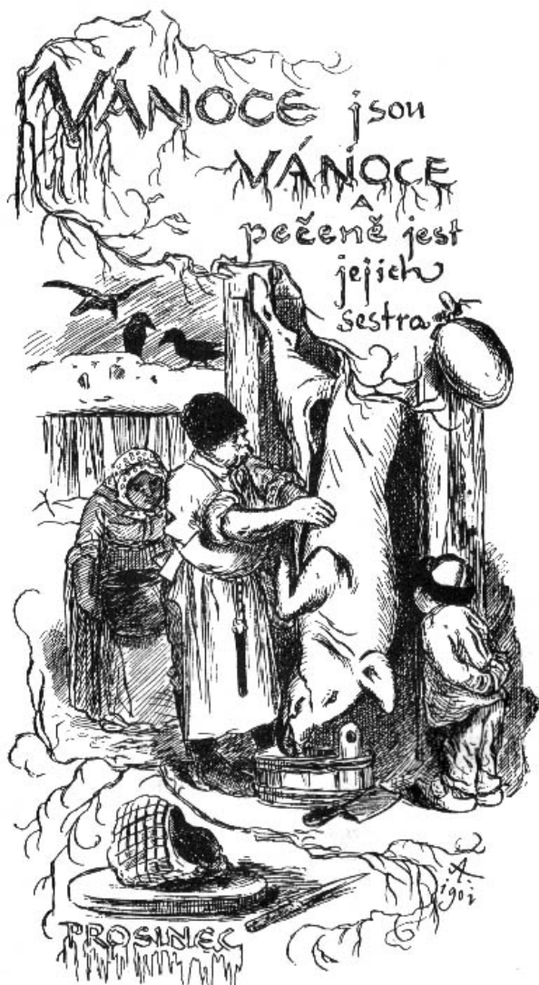
Mikoláš Aleš - Prosinec

Hvězdička , čtvrtletník obce Nezamyslice. Redaktoři: členové OZ, pracovníci OÚ, kronikář obce Mgr.Bohumil Outrata a ostatní dopisovatelé z řad členů organizací a občanů obce; grafická úprava: Lukáš Doubrava; obrázek na titulní straně: Mgr.Bohumil Outrata; tisk a vydavatel: OÚ Nezamyslice, Tjabinova 111; vydáno 17. prosince 2002.