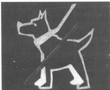
příloha č. 1