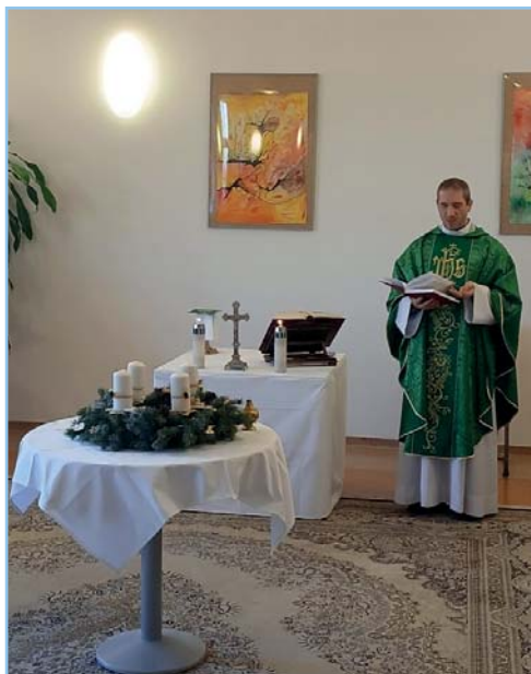
Mše svatá a požehnání adventního věnce v Domově "Na Zámku"

Samotný začátek adventního období nám také přinesl slavnostní náladu, a to hlavně díky tradiční Adventní výstavě, která se letos uskutečnila v neděli 1. 12. Umožnila návštěvníkům nahlédnout do světa kreativity klientů. Klub městyse Nezamyslice se proměnil v útulnou galerii plnou originálních rukodělných výrobků. Na návštěvníky čekaly výrobky z dílny košíkářské, tkalcovské, keramické a mnoho dalších výrobků uživatelů Domova „Na Zámku“.